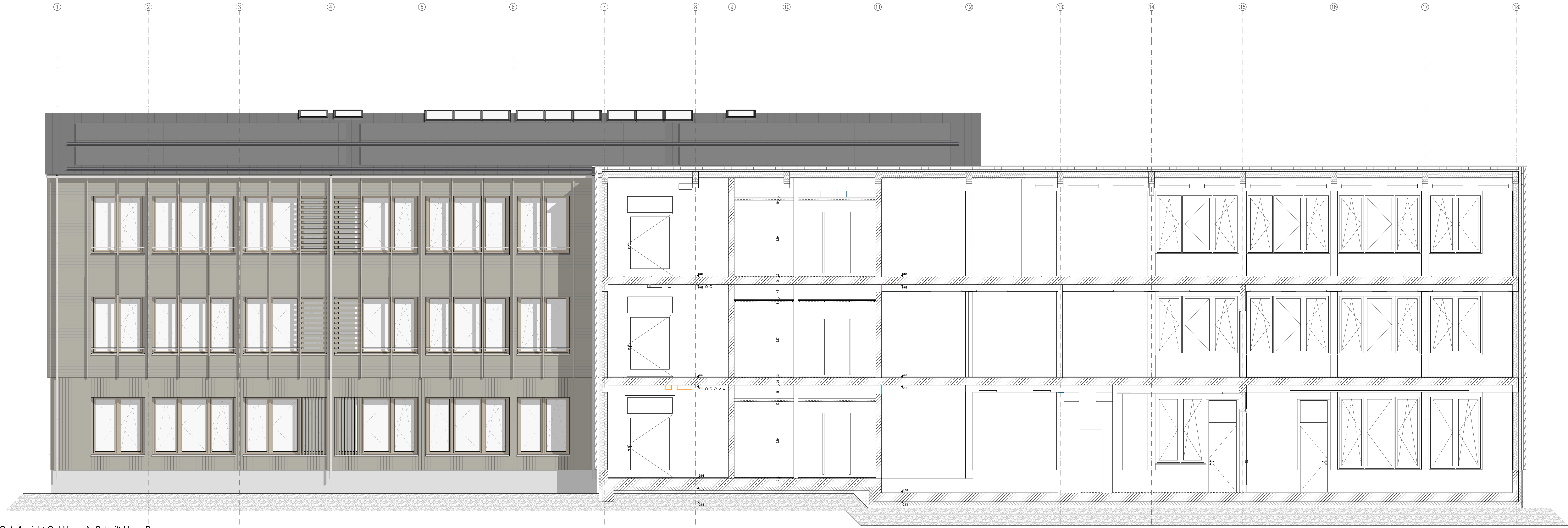
Schnittansicht West: Ansicht West Haus C. Schnitt Haus B